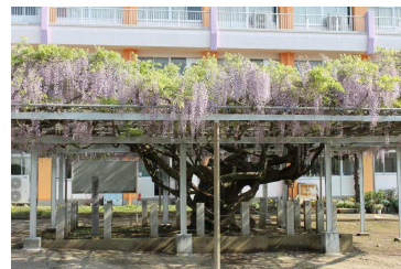
本校のシンボル「ノダフジ」

私たちの学校では、夏休みに地区探検活動を行っています。自分たちの通学路のようすや地区にある施設などについて、保護者と一緒に探検し、一枚の地図にまとめる活動に取り組んでいます。探検活動の中で見つけた私たちの地域のようすについて、紹介します。